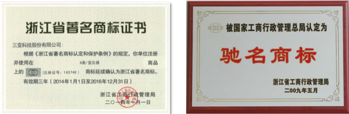
表3.3-2公司诚信经营成果

公司高管带头认真学习《公司法》、《合同法》、《产品质量法》、《安全生产法》等有关法律，在国家规定的法令、规章、制度范围内进行生产经营活动，遵守企业的章程、决议、制度。《公司章程》对董事、总经理层贯彻执行法律、行政法规，履行诚信和勤勉的义务等方面做了明确的规定，并通过签订保密协议、竞业协议、授权代理职务协议等方式，坚持合法经营，依法纳税，诚信为本，一切活动遵守中国的法律、法令和有关条例规定。