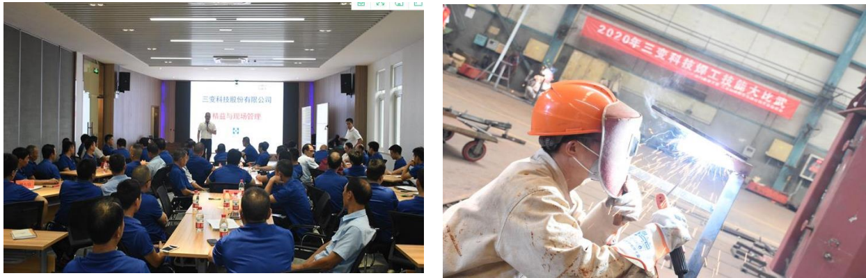
图 3.2-1 各类培训活动

公司每年针对实际和市场形势，识别各部门的培训需求，制定员工培训规划和年度计划，开展职工教育培训，包括质量意识、质量知识、管理制度、专业知识等培训内容。公司每年制定并下发了《年度培训计划》等，对质量诚信教育进行了安排布置。