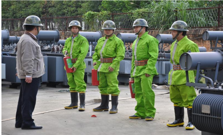
图 6.3-01 应急消防演练现场

公司每年举行消防演练和各种灾害应急演练。公司制订了《配电房火灾、爆炸应急预案》等应急预案、《触电事件应急预案》、《重大设备故障应急预案》等应急处置方案等，对火灾、机械、触电等均有相应的应急措施，并成立了应急指挥中心和应急救援专业组。